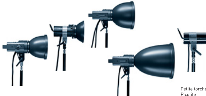
Pulso G 32.115.XX 1600 J Pulso G 32.116.XX 3200 J Unilite 32.113.XX 1600 J Unilite 32.114.XX 3200 J