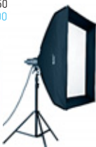
Pulsoflex EM 110 x 110 33.408.00