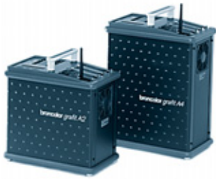
Grafit A2 / RFS 31.166.XX / 31.169.XX Grafit A4 / RFS 31.176.XX / 31.179.XX