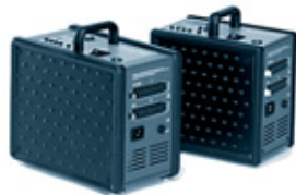
Nano 2 31.151.XX Nano A4 31.172.XX