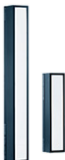
Striplite 120 Evolution 32.303.XX Striplite 60 Evolution 32.301.XX