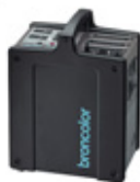
Alimenté par réseau