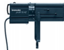
Spot de poursuite Profil 15/42 32.437.XX