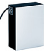
Boxlite 40 32.341.XX