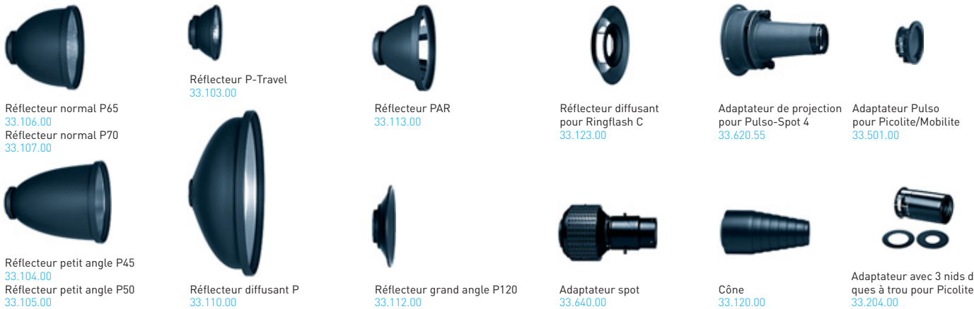
Réflecteur normal P65 33.106.00 Réflecteur normal P70 33.107.00