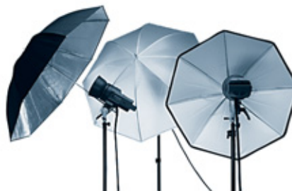
Parapluie argenté Ø 82 cm 33.459.00 Parapluie argenté Ø 102 cm 33.452.00 Parapluie transparent Ø 102 cm 33.454.00 Parapluie blanc Ø 82 cm 33.460.00 Parapluie blanc Ø 102 cm 33.453.00