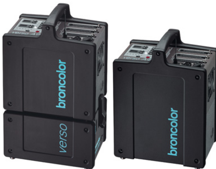
Verso A2 RFS avec Power Dock

Raccordé au réseau, le Verso A2 se recharge complètement en moins d'une seconde (1,7 s pour Verso A4 à 230 V). Même en