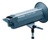
Minipuls C200 31.449.XX