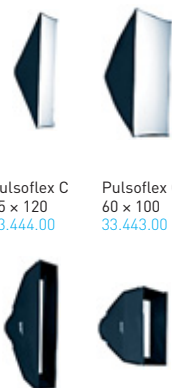
Pulsoflex C 35 x 120 33.444.00