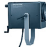
Pulso-Spot 4 32.425.XX