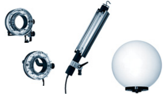
Ringflash C 32.462.XX Ringflash P 32.461.XX