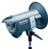
Minicom 80 / RFS 31.415.XX / 31.416.XX