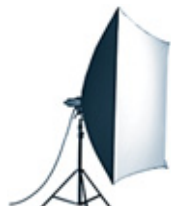
Pulsoflex C 150 x 150 33.445.00

sans bagues d'adaptation et pieds pas inclus