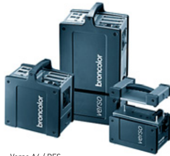
Verso A4 / RFS 31.032.XX / 31.033.XX Verso A2 / RFS 31.030.XX / 31.031.XX Power Dock pour Verso A2 / A4 / RFS 36.124.00