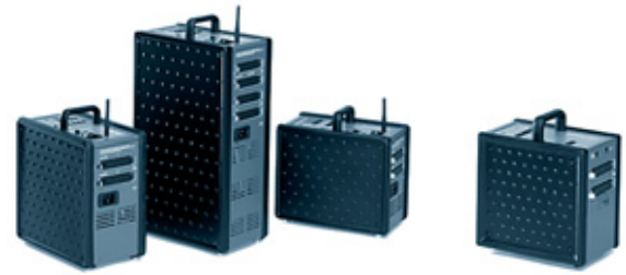
Topas A2 / RFS 31.168.XX / 31.173.XX Topas A4 / RFS 31.178.XX / 31.174.XX Topas A8 Evolution / RFS 31.184.XX / 31.183.XX