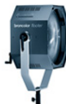
broncolor Floorer 32.431.00