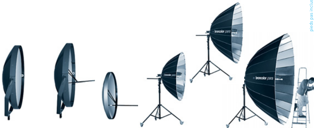
Satellite Staro 33.151.00