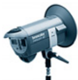
Minicom 40 / RFS 31.405.XX / 31.406.XX